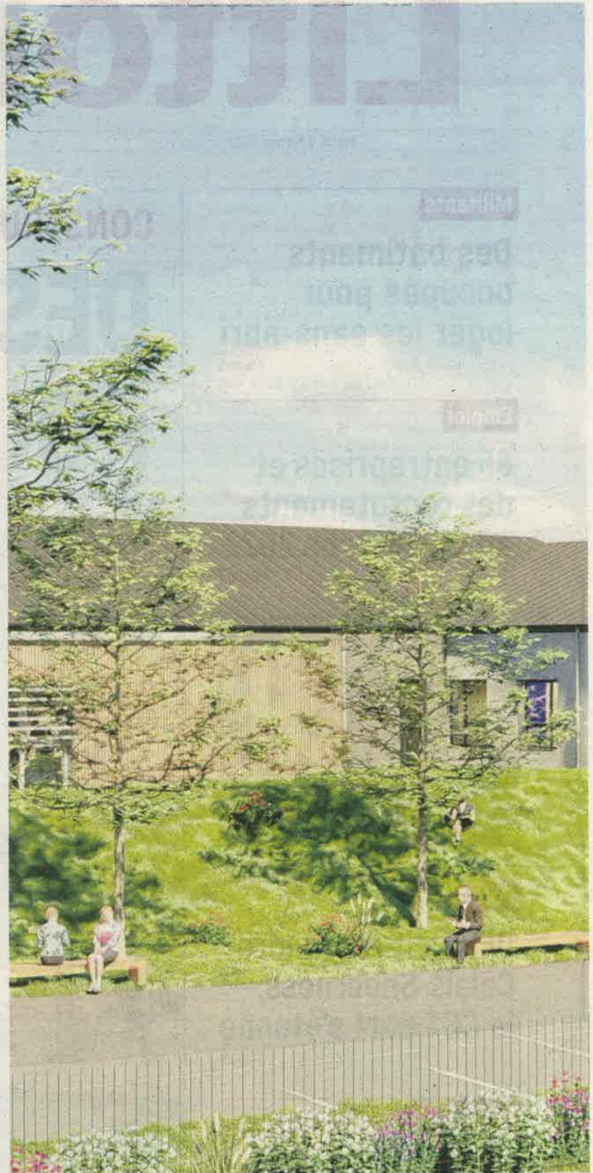
Les illustrations montrent très bien la qualité architecturale du futur établissement.

Crise sanitaire oblige, le planning a évolué et les places ont finalement commencé à fonctionner en 2021 dans des structures de type modu-